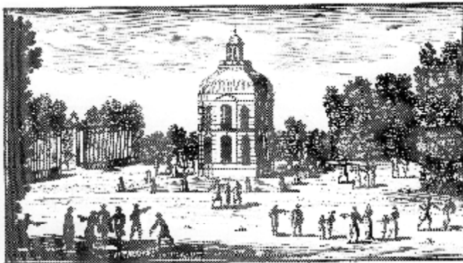
Le pavillon de la machine de la grande de Meudon