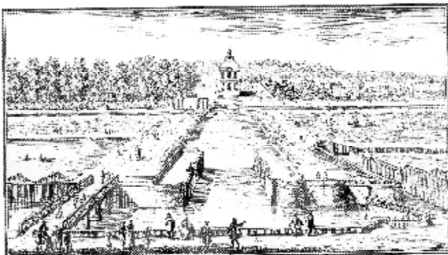
Le pavillon de la machine de la grande de Meudon